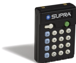
(TRAC-Key, FOTO 4)

L'accesso alle recinzioni avverrà innestando la tastiera elettronica TRAC-Key (FOTO 4) nel TRAC-Padlock (FOTO 1) e digitando sullo stesso il pin-code. Con una analoga operazione si accederà alla Chiave Maestra contenuta nel TRAC-Box (FOTO 2), fissato su una parete all'esterno dei locali di interesse; con la chiave così prelevata gli operatori dell'Ente e delle ditte fornitrici potranno accedere a tutti i diversi locali di loro pertinenza.