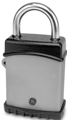
(TRAC-Padlock, FOTO 2)

Ciò che caratterizza TRACAccess è l'assoluta libertà di applicazione, perché i dispositivi di campo non necessitano di collegamento né ad infrastrutture telematiche, né alla rete elettrica.