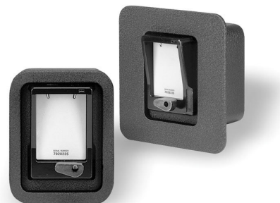
(TRAC-Vault, FOTO 1)

Le "Chiavi Ordinarie" necessarie alle operazioni presso i siti saranno contenute nei dispositivi blindati della linea TRACcess, installati presso i siti interessati ed a disposizione degli operatori, i quali potranno ottenerle tramite l'uso del "Tastierino Elettronico" della linea TRACcess in dotazione.