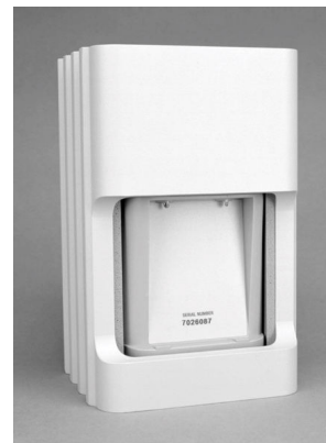
(TRAC-Box, FOTO 3)

Il sistema prevede la collocazione dei lucchetti elettronici (FOTO 2) sui cancelli/varchi dei siti controllati e dei contenitori blindati per le chiavi (FOTO 3) sulla parete nei pressi delle porte di accesso ai locali tecnici.